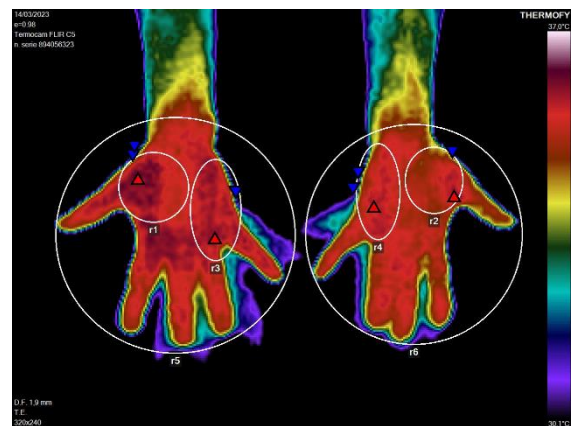
Figura 2. Termografía palmar de manos última consulta

Se decide realizar nuevamente estudio termográfico en las áreas localizadas en la palma de las manos que presentaron hiporradiación o hiper-radiación, comparando las asimetrías en las regiones contralaterales y con las mismas condiciones realizadas de la primera Termometría cutánea de manos, utilizando equipo Termocam FLIR C5, climatización y estabilización térmica del paciente como se observa en la Figura 2 y Tabla 4.